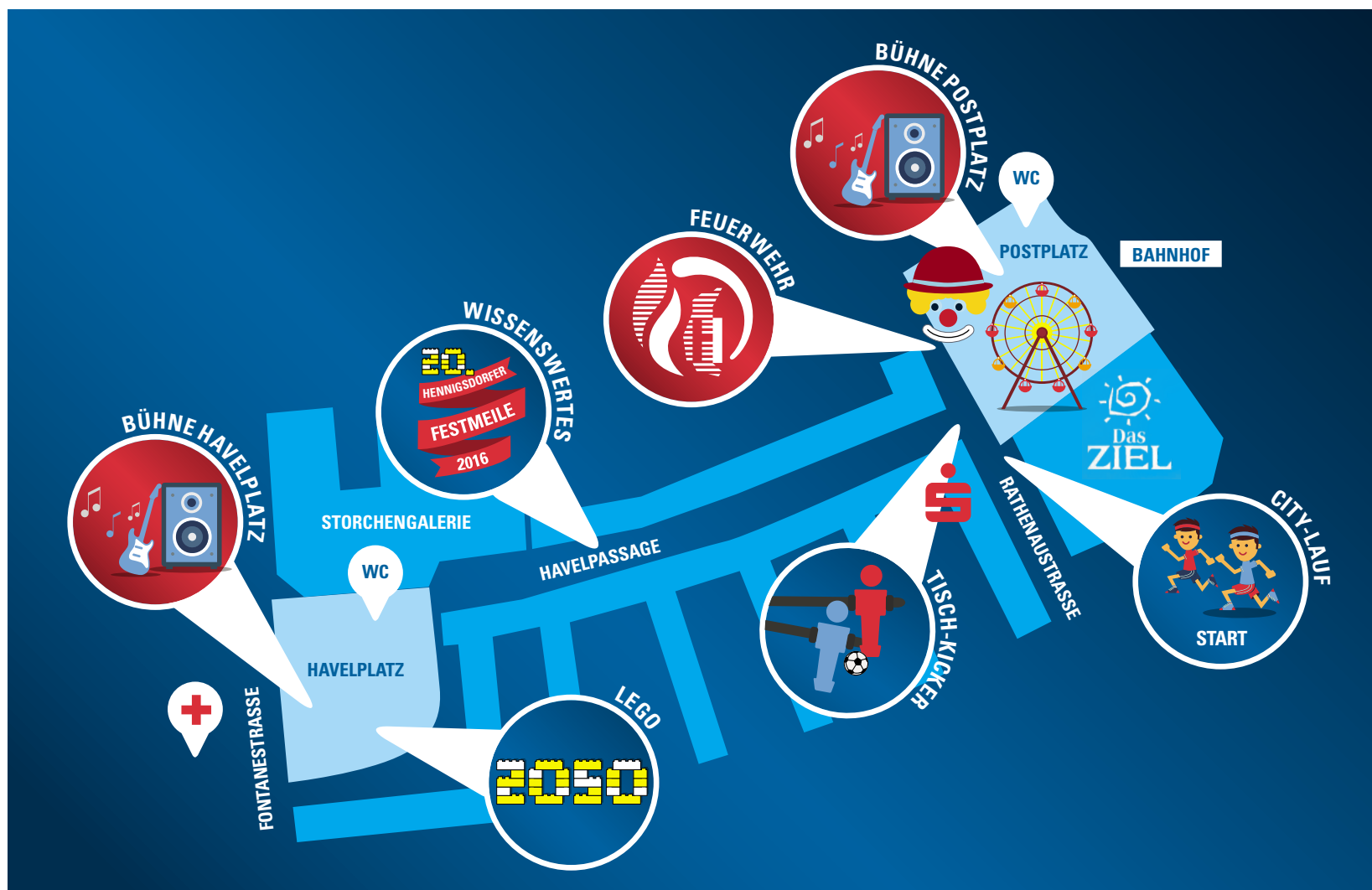
Die Hennigsdorfer Festmeile befindet sich zwischen Havelplatz und Schlossplatz.