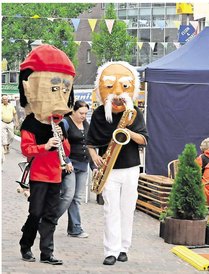
Musikalischer Walkact bei der Festmeile.