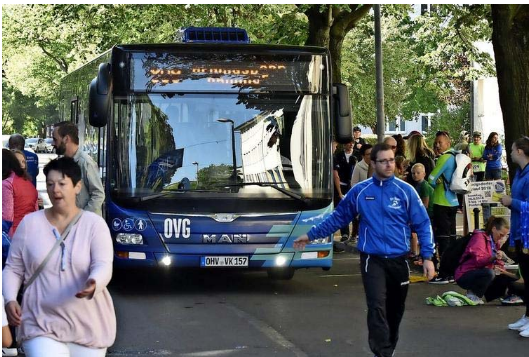
Die Linienbusse der OVG sorgen für etwas Aufregung beim 21. Hennigsdorfer City-Lauf und am Ende auch für einen