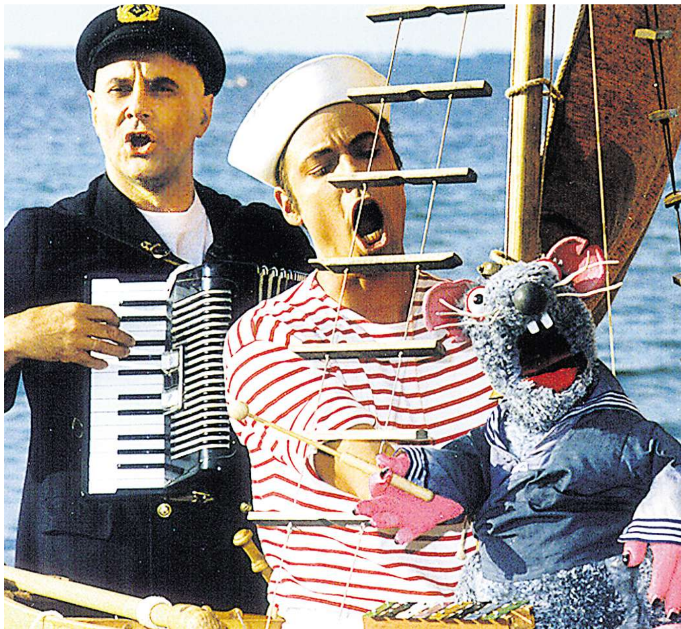
Die Schlickschipper, der kleinste Shantychor der Welt, steht ab 13 Uhr auf der Hafenterrasse.

14 bis 14.45 Uhr: „Die Reise zur Schatzinsel“ mit dem Wunderland-Theater startet. Es ist ein Mitmach-Musik-Theater für Kinder, aber auch für alle anderen, denn in diesem Stück werden alle auf eine wunderbare Reise voller Abenteuer