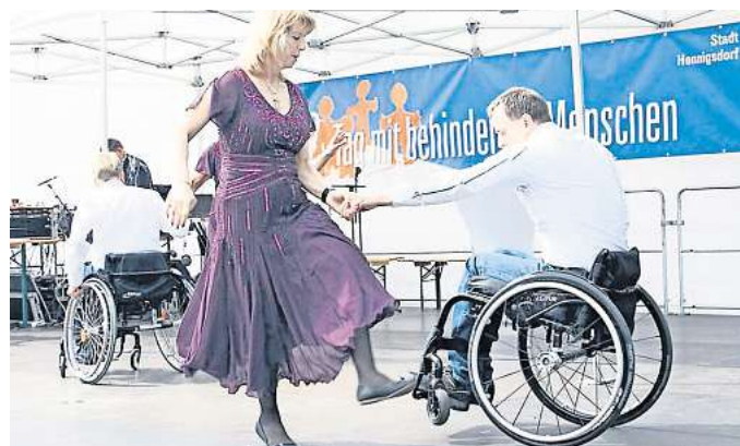
Auch die Rollstuhltänzer treten auf.