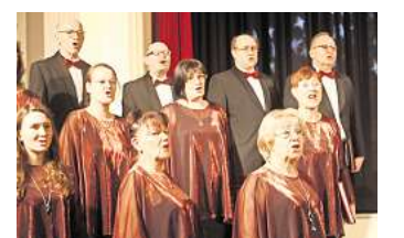
Viele Mitglieder des Chors haben noch unter Leo Wistuba gesungen.

Heute hat das Hennigsdorfer Ensemble 36 aktive Sängerinnen und Sänger, ist allerdings immer auf der Suche nach Nachwuchs. Mehr Informationen gibt es auf der Homepage unter http://klw.li-ma-city.de/ .