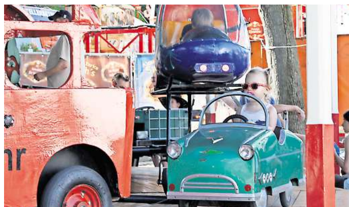
Kinderkarussells wird es wie jedes Jahr geben.